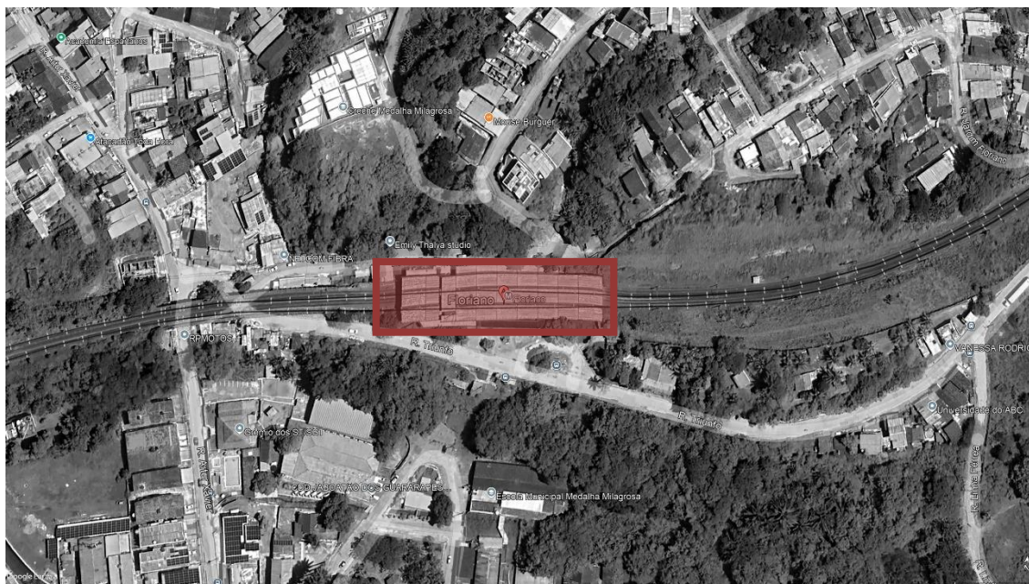
FIGURA 1 – ESTAÇÃO FLORIANO